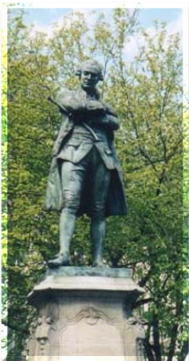
Памятник Бомарше в Париже

Бомарше умер 18 мая 1799 года. Кончина стала большой неожиданностью для всей семьи. Бомарше был похоронен в семейной могиле, где погребены его многочисленные родственники.