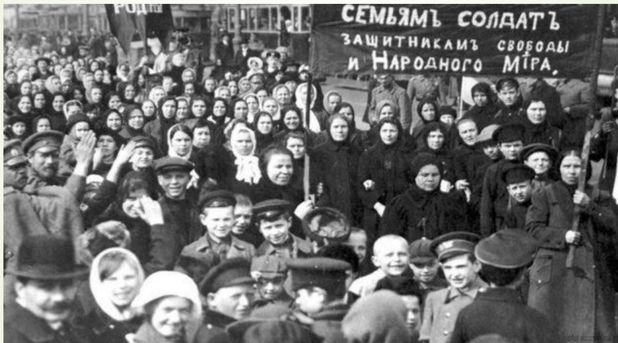
Массовые забастовки в 1917 году

1917 – год потрясений и революций в России и его финал наступил в ночь на 25 октября, когда вся власть перешла к Советам. Каковы причины, ход, итоги Великой Октябрьской Социалистической революции – эти и другие вопросы истории сегодня в центре нашего внимания.