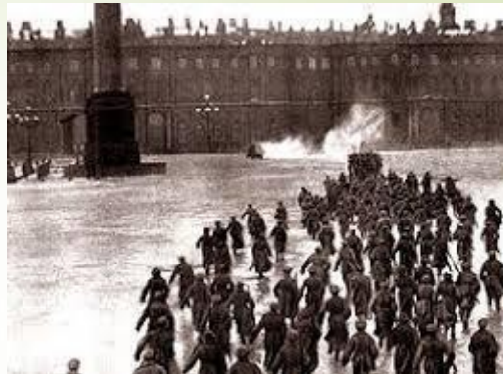
Картина М. Соколова «Арест временного правительства. Петроград. 1917 год»