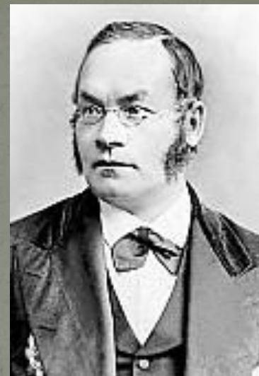
Воронов Андрей Степанович (1819—1875), русский педагогический деятель, автор одного из первых проектов введения обязательного образования в Российской империи.

Именно усилия прогрессивных педагогов подготовили те преобразования, которые начинаются в школьном деле во второй половине XIX века.