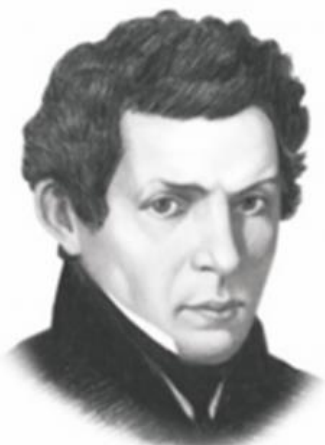
ЛОБАЧЕВСКИЙ НИКОЛАЙ ИВАНОВИЧ (1792-1856) русский математик

Министерство народного просвещения приняло ряд мер по сокращению объема гимназического образования. В 1844 году из учебного плана была исключена статистика, в 1845 году ограничено преподавание математики, в 1848 году изгнана логика. С 1849 г. гимназии были разделены на классические, которые готовили к высшему образованию, и реальные, которые подготавливали "способных людей для службы военной и гражданской". В классических гимназиях основное учебное время отводилось на изучение древних языков, русской словесности и истории. В реальных гимназиях изучался курс практической математики и законоведения, который зачастую сводился к механическому заучиванию многочисленных законов.