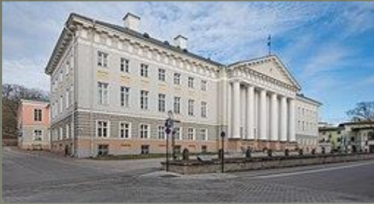
Императорский Днепропетровский университет