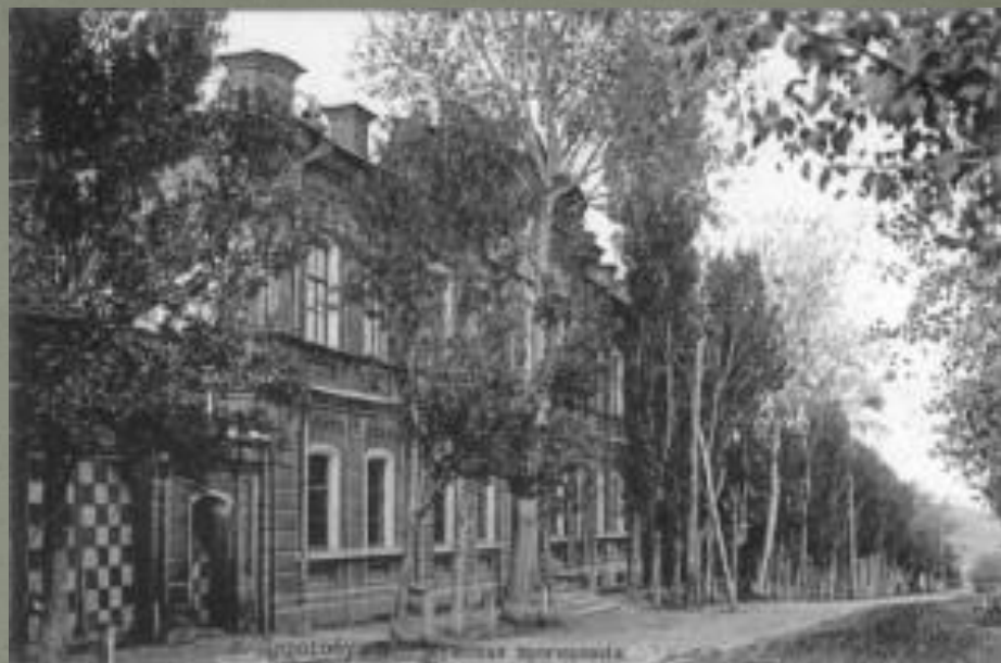
Мужская гимназия в г. Дорогобуж

Устав 1804 г. исходил из необходимости наглядности преподавания, связи теории с практикой. Эти дидактические советы подкреплялись требованием создать при гимназиях библиотеки и кабинеты, оборудованные необходимыми учебными пособиями: картами и атласами, глобусом, чертежами машин, геометрическими и геодезическими приборами, наглядными приборами для уроков физики.