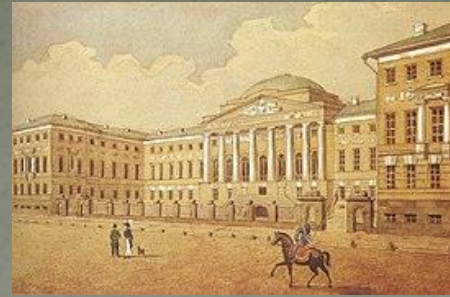
Императорский Московский университет