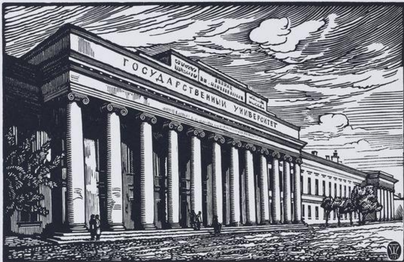
Казанский императорский университет. Гравюра