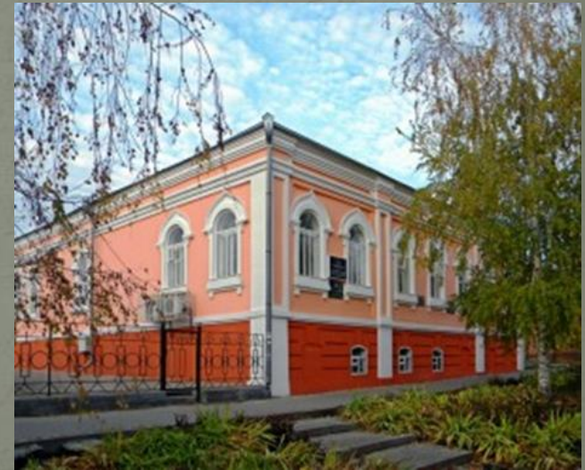
Уездное училище в г. Бирюч Белгородской области

В уездных училищах полагалось преподавать двум учителям с обязанностью преподавать большое число предметов (по 28 часов в неделю).