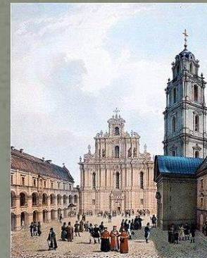
Императорский Виленский университет