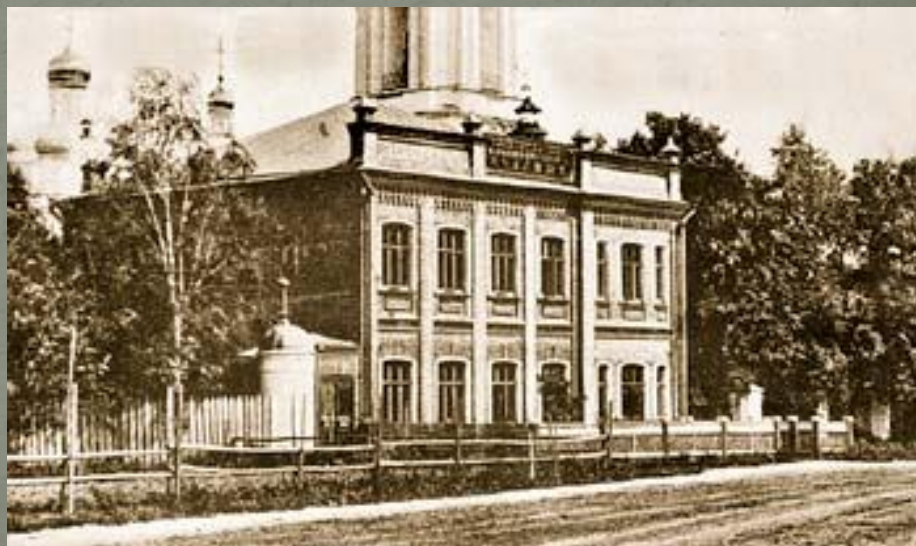
Приходское училище в Павловском Посаде

В приходские училища принимались дети всякого состояния. Девочек разрешалось принимать только в приходские училища.