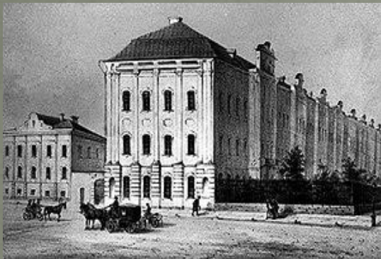
Императорский Санкт-Петербургский университет