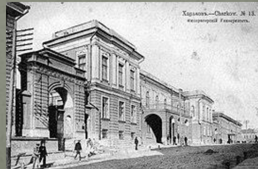
Императорский Харьковский университет