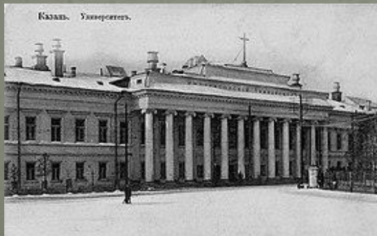
Императорский Казанский университет