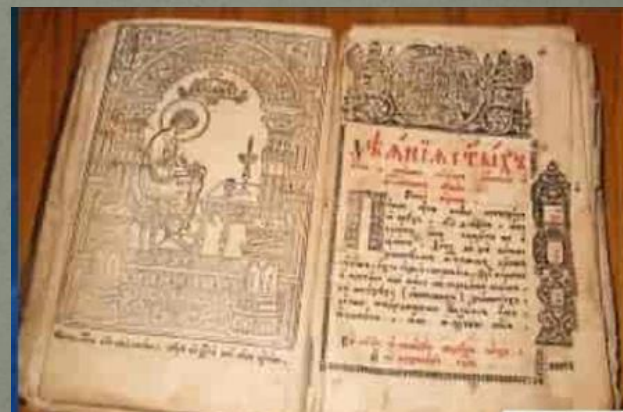
Древние рукописные книги Древней Руси