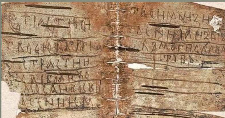
Береста, найденная в г. Новгород

В качестве писчего материала использовалась береста. Археологами найдено значительное количество ученических берестяных грамот с записью упражнений в написании букв, слогов, предложений, цифровых алфавитов; с изображением детских рисунков. К числу находок относятся и первоначальные пособия по изучению грамоты, например, пятиугольная цера - специально обработанная дощечка с вырезанной на ней азбукой. Как утверждают археологи, такие азбуки изготовлялись на продажу. Обучение в народе считалось делом важным, и первоначальные учебные пособия пользовались широким спросом.