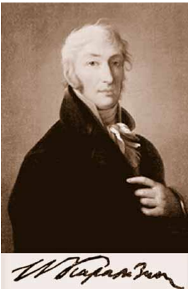
Дамон-Ортолани Дж. Портрет Н.М. Карамзина. 1805