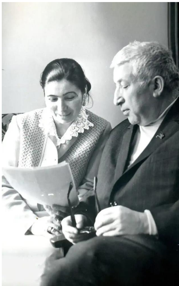
Фазу Алиева и Расул Гамзатов

более ста произведений и книг. Ее стихи, переведенные на 68 языков мира, включая английский, немецкий и арабский, покорили сердца миллионов читателей. Она училась у ведущих литераторов своего времени, постоянно совершенствуя свое мастерство.