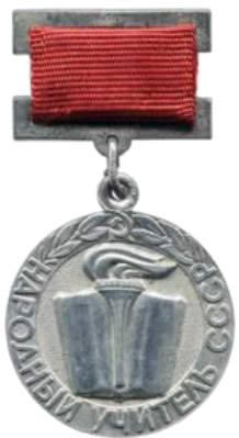
Народный учитель СССР