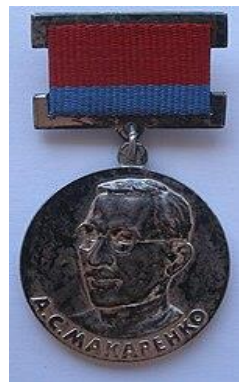
Медаль А. С. Макаренко