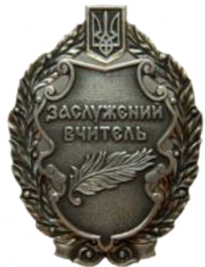
Заслуженный учитель Украины