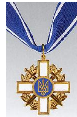
Орден за мужество