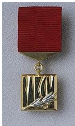
Премия Ленинского комсомола