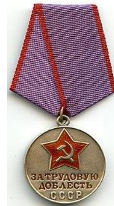
Медаль «За трудовую доблесть»