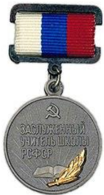
Заслуженный учитель школы РСФСР