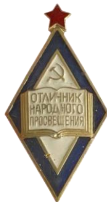
Отличник народного просвещения