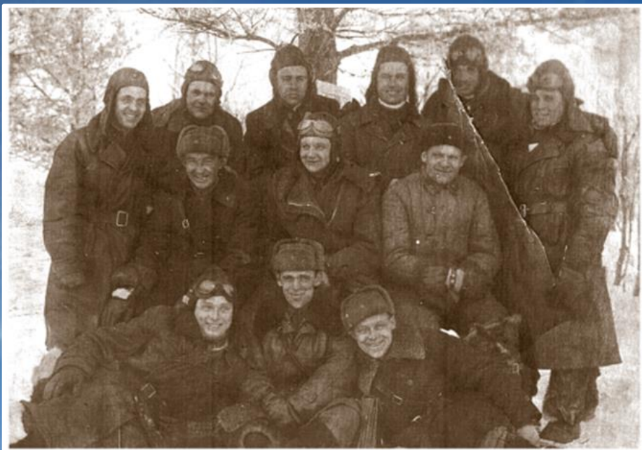
Летчики 158 ИАП, 1942 год

В 1939-м был призван в армию и по спецнабору был направлен в Читинскую военную авиационную школу пилотов. Позднее школа из Читы была переведена в Батайск.